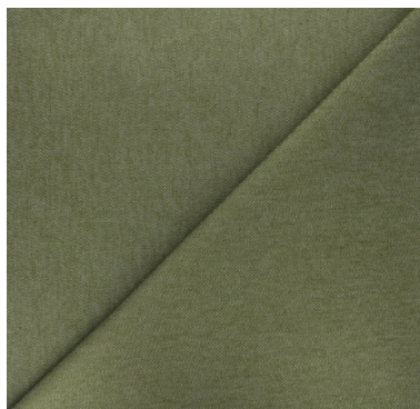
Jean élasthanne kaki Ma Petite Mercerie