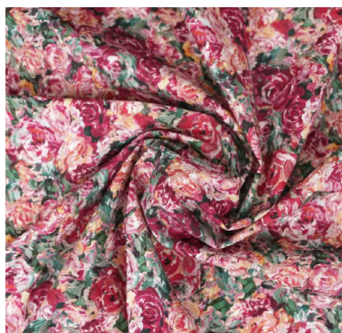
Coton imprimé Pretty Mercerie