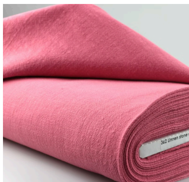
Lin lavé Driessen Stoffen