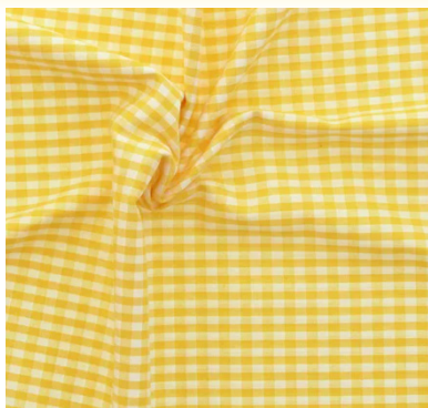
Vichy jaune Rascol

ATTENTION : l'assemblage de la robe, de la parementure, du volant et des bretelles nécessite de coudre beaucoup d'épaisseurs. Si vous choisissez un tissu épais, je vous recommande de ne pas coudre le volant, ou de coudre votre parementure dans un tissu plus fin.