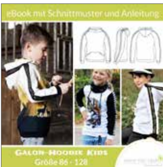
Galon-Hoodie Kids Unisex Gr. 86 - 128