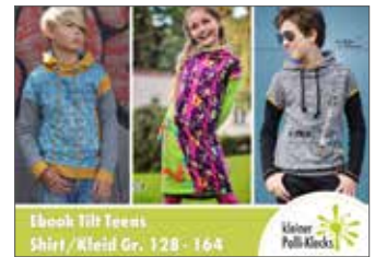
Tilt Teens Shirt/Kleid • Größe 128 - 164