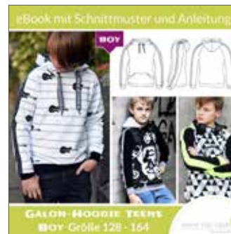
Galon-Hoodie Teens BOY gerade Passform Gr. 128 - 164