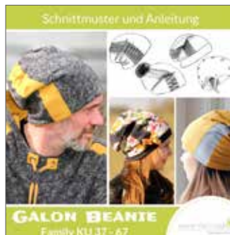
Galon-Beanie FAMILY variantenreiche Mütze KU 37 - 67