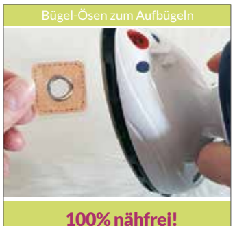
Bügel-Ösen in Lederoptik in 9 Farbvarianten