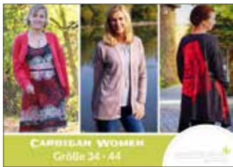
Cardigan Women Jacke/Mantel • Größe 34 - 44