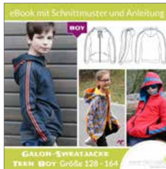
Galon-Sweatjacke Teen BOY gerade Passform Gr. 128 - 164