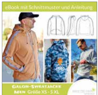
Galon-Sweatjacke Men gerade Passform Gr. XS - 5XL