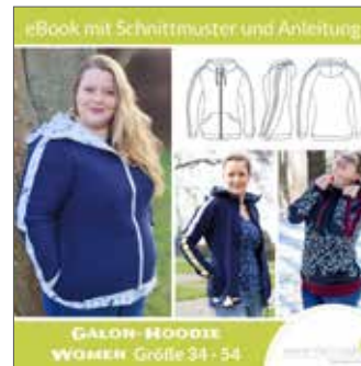
Galon-Sweatjacke Women taillierte Passform Gr. 34 - 54