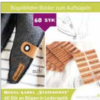
Bügelbilder in Lederoptik „Statemants“