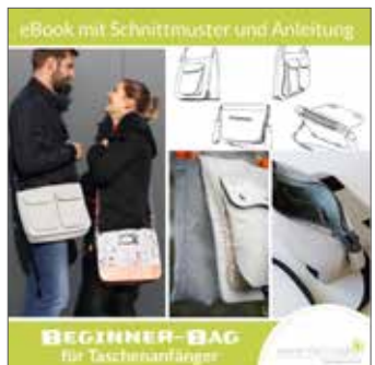
Beginner-Bag Anfängertasche unisex Umhängetasche