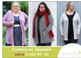
Cardigan Women curvy Jacke/Mantel • 44 - 54