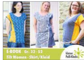
Tilt Damen Shirt/Kleid • Größe 34 - 52