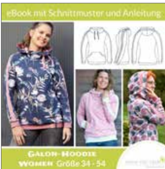
Galon-Hoodie Women taillierte Passform Gr. 34 - 54