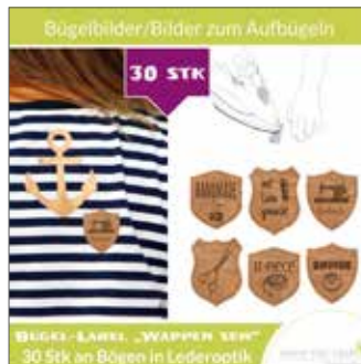
Bügelbilder in Lederoptik „Wappen Sew“