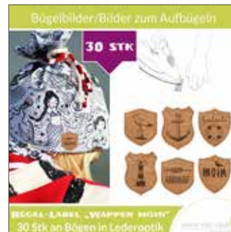
Bügelbilder in Lederoptik „Wappen Moin“