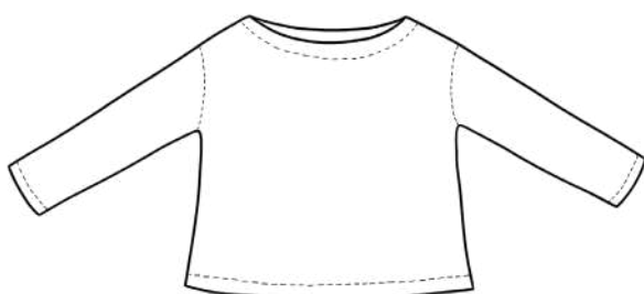
Version B : Manches longues