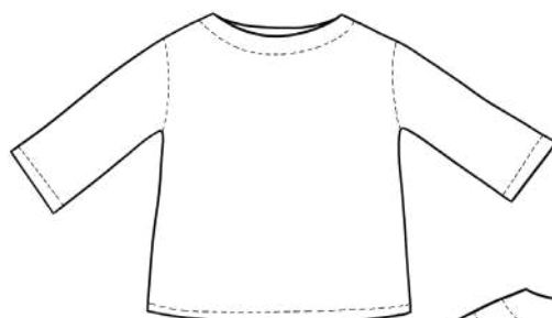
Version A : Manches 3/4