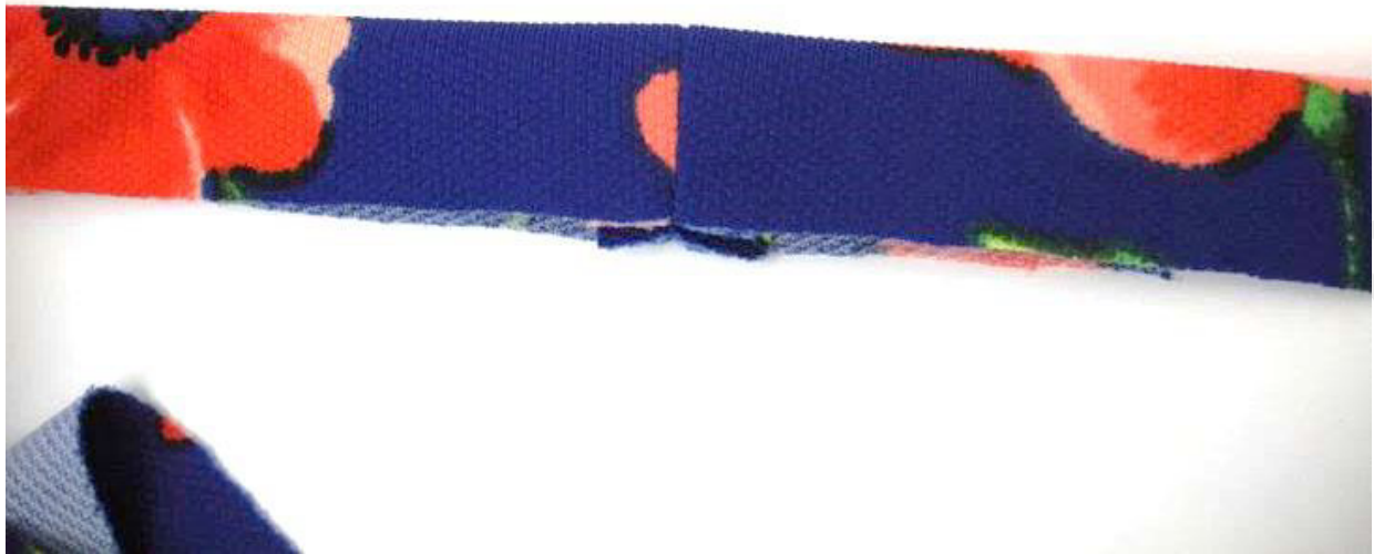
Die Naht am Bündchen.