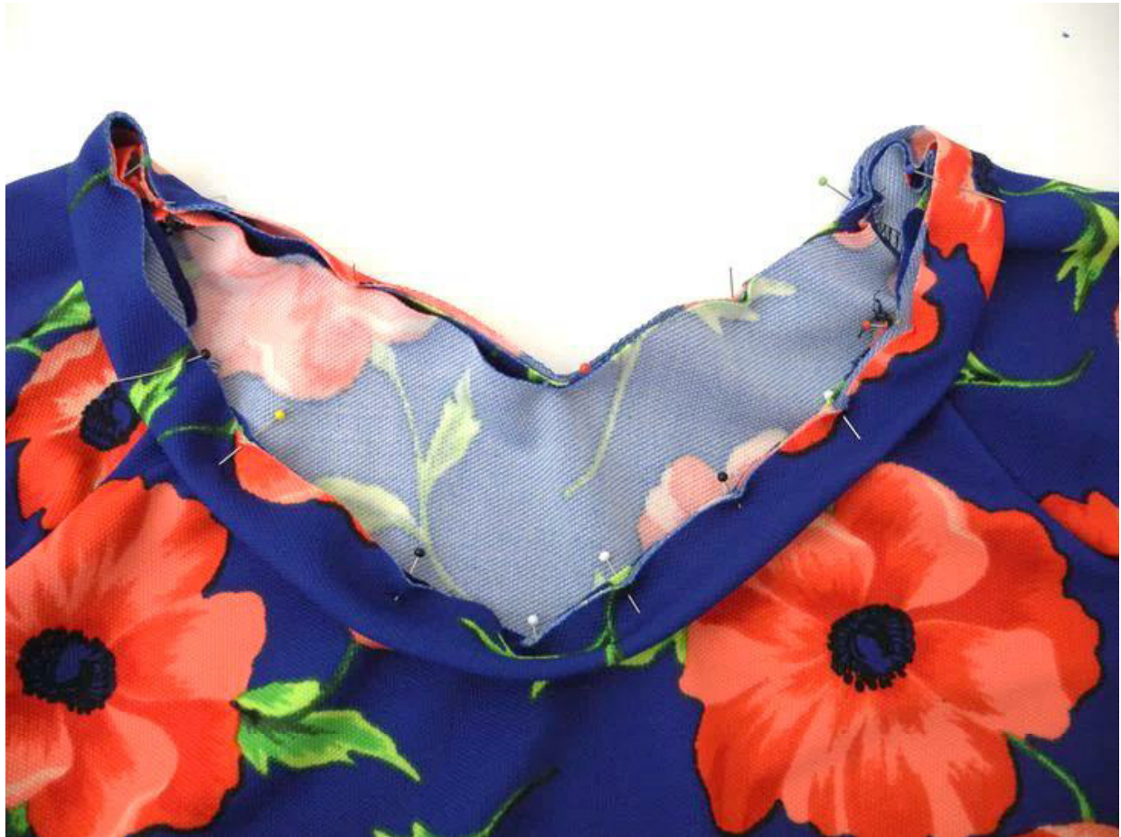
Hier schaut das Bündchen nach außen.