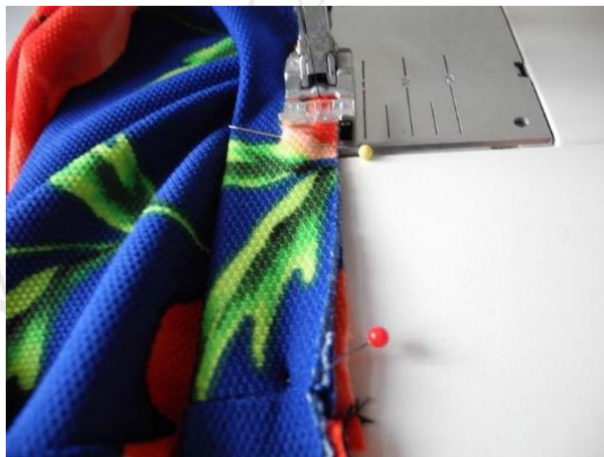
Das Bündchen wird mit einem einfachen Stich schmalkantig ca. 5 mm angenäht. So kann man vor der eigentlichen Naht kontrollieren ob alles in Ordnung ist.