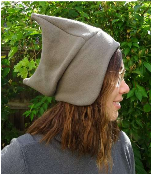
Mütze aus dünnem Fleece.

E-book Zipfelmütze Dreispitz- Alle Rechte an der Anleitung liegen bei Susan Stransky. Es ist erlaubt genähte Mützen aus dieser Anleitung bis 50 Stück pro Jahr zu verkaufen mit dem Hinweis: Schnitte von Susi- Knuddelbunt .Eine Massenproduktion sowie eine Weitergabe der Anleitung ist nicht gestattet.