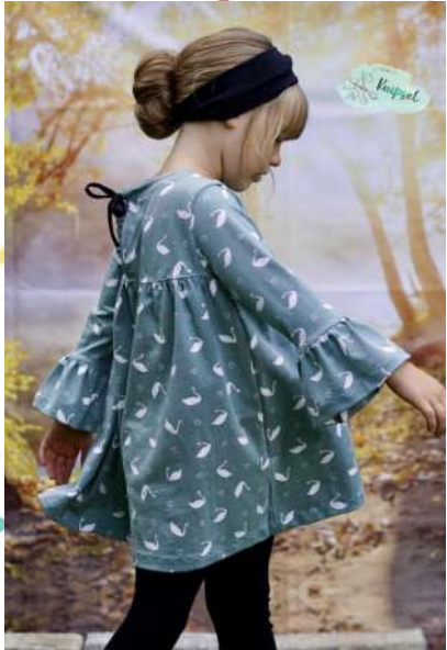
In Tunikalänge mit Glöckenärmel