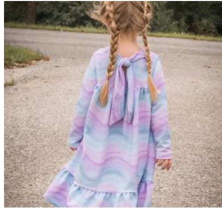
Mit Schlitz und Schleife am Rücken