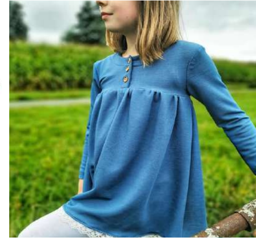
Mit Knopfleiste am Vorderteil Mit Knopfleiste am Rückteil