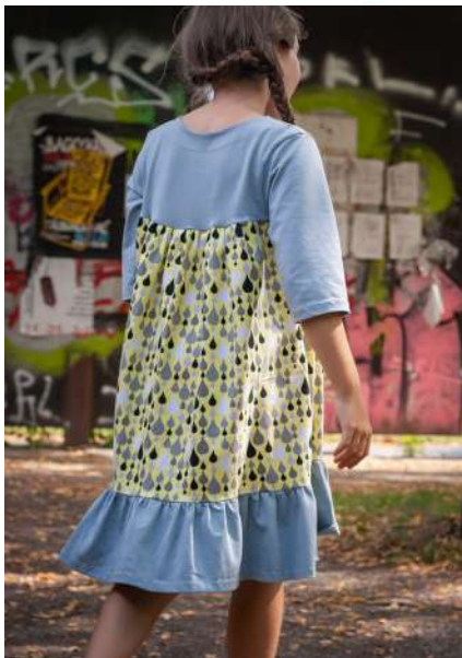
In Tunikalänge mit Saumrüsche