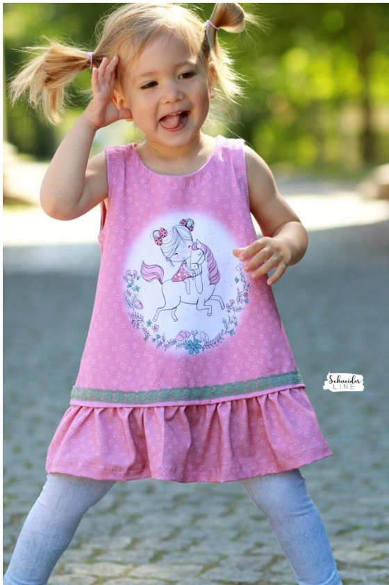
Girly Dress als Sommer Kleid mit Belegen und verdeckt angenähter Rüsche mit Spitze