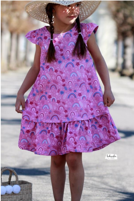
Girly Dress als Sommer Kleid mit Belegen, Flügelärmelchen und verdeckt angenähter Rüsche