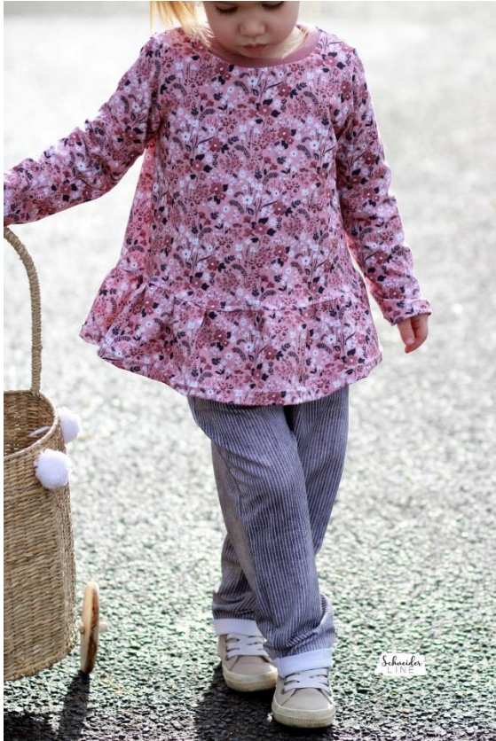
Girly Dress als Shirt mit gesäumten Ärmeln in Kombination mit der Schlupfhose