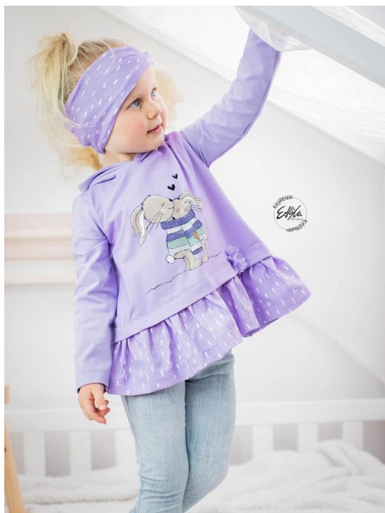
Girly Dress als Shirt mit Kapuze, gesäumten Ärmeln und verdeckt angenähter Rüsche

Alle Rechte dieses Ebooks (Anleitung und Schnittmuster) liegen bei „Schneiderline“ Für Fehler in der Anleitung oder im Schnittmuster oder für eventuell entstandene Schäden kann keine Haftung übernommen werden. Es ist verboten dieses Ebook, oder Teile daraus, zu veröffentlichen, weiterzugeben, zu vervielfältigen oder zu verkaufen. Ebenfalls ist eine gewerbliche sowie kommerzielle Nutzung untersagt. Es dürfen jedoch bis zu 5, nach diesem Ebook gefertigte Teile verkauft werden. Hierbei bitte angeben: Schnittmuster „Girly Dress“ von Schneiderline