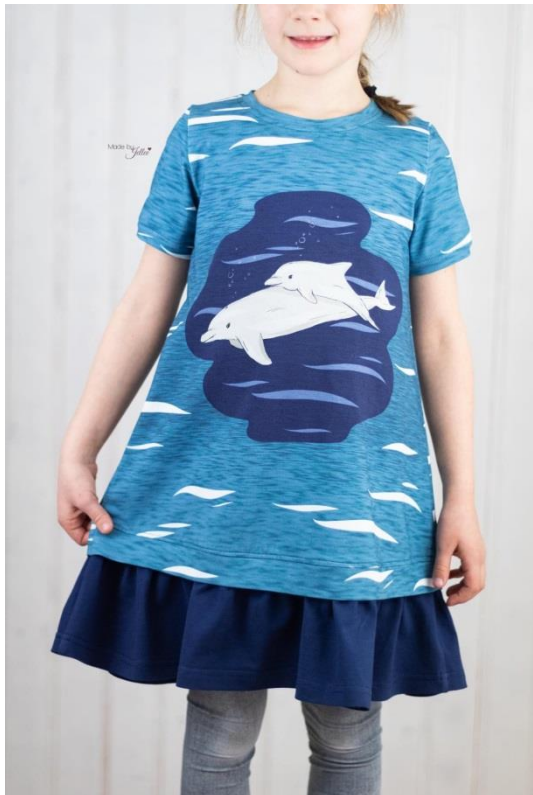
Girly Dress als Kleid mit Halsbündchen, kurzen Ärmeln und verdeckt angenähter Rüsche

Alle Rechte dieses Ebooks (Anleitung und Schnittmuster) liegen bei „Schneiderline“ Für Fehler in der Anleitung oder im Schnittmuster oder für eventuell entstandene Schäden kann keine Haftung übernommen werden. Es ist verboten dieses Ebook, oder Teile daraus, zu veröffentlichen, weiterzugeben, zu vervielfältigen oder zu verkaufen. Ebenfalls ist eine gewerbliche sowie kommerzielle Nutzung untersagt. Es dürfen jedoch bis zu 5, nach diesem Ebook gefertigte Teile verkauft werden. Hierbei bitte angeben: Schnittmuster „Girly Dress“ von Schneiderline