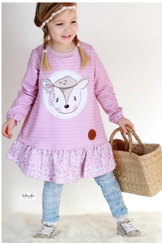
Girly Dress als Kleid mit Halsbündchen, Ärmel mit Gummizug und verdeckt angenähter Rüsche