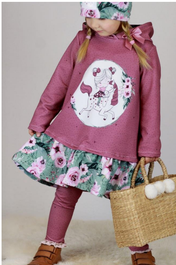
Girly Dress als Winter Kleid mit Kapuze und verdeckt angenähter Rüsche

Alle Rechte dieses Ebooks (Anleitung und Schnittmuster) liegen bei „Schneiderline“ Für Fehler in der Anleitung oder im Schnittmuster oder für eventuell entstandene Schäden kann keine Haftung übernommen werden. Es ist verboten dieses Ebook, oder Teile daraus, zu veröffentlichen, weiterzugeben, zu vervielfältigen oder zu verkaufen. Ebenfalls ist eine gewerbliche sowie kommerzielle Nutzung untersagt. Es dürfen jedoch bis zu 5, nach diesem Ebook gefertigte Teile verkauft werden. Hierbei bitte angeben: Schnittmuster „Girly Dress“ von Schneiderline