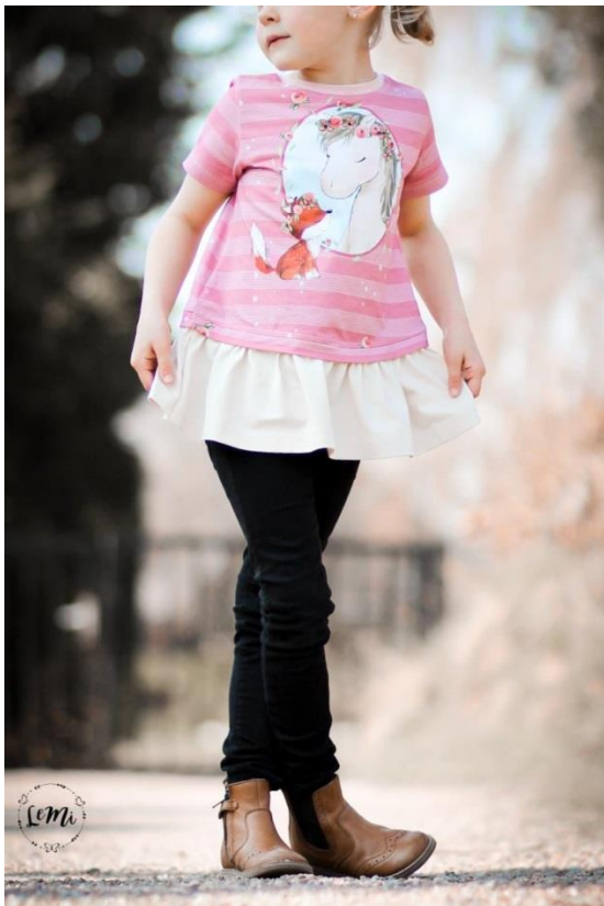
Girly Dress als Shirt mit kurzen Ärmeln in Kombination mit Jeggings

Alle Rechte dieses Ebooks (Anleitung und Schnittmuster) liegen bei „Schneiderline“ Für Fehler in der Anleitung oder im Schnittmuster oder für eventuell entstandene Schäden kann keine Haftung übernommen werden. Es ist verboten dieses Ebook, oder Teile daraus, zu veröffentlichen, weiterzugeben, zu vervielfältigen oder zu verkaufen. Ebenfalls ist eine gewerbliche sowie kommerzielle Nutzung untersagt. Es dürfen jedoch bis zu 5, nach diesem Ebook gefertigte Teile verkauft werden. Hierbei bitte angeben: Schnittmuster „Girly Dress“ von Schneiderline