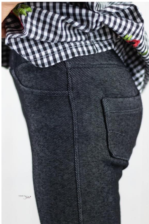
Jeggings mit Fake Kappnaht, Fronttasche, Sattel und abgestepften Nähten

Alle Rechte dieses Ebooks (Anleitung und Schnittmuster) liegen bei „Schneiderline“ Für Fehler in der Anleitung oder im Schnittmuster oder für eventuell entstandene Schäden kann keine Haftung übernommen werden. Es ist verboten dieses Ebook, oder Teile daraus, zu veröffentlichen, weiterzugeben, zu vervielfältigen oder zu verkaufen. Ebenfalls ist eine gewerbliche sowie kommerzielle Nutzung untersagt. Es dürfen jedoch bis zu 5, nach diesem Ebook gefertigte Teile verkauft werden. Hierbei bitte angeben: Schnittmuster „Jeggings“ von Schneiderline