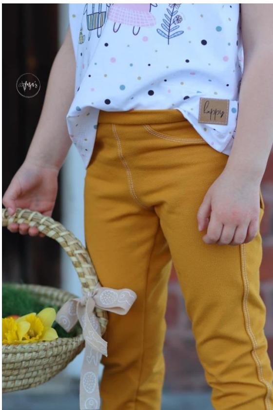
Jeggings mit abgesteppten Nähten

Alle Rechte dieses Ebooks (Anleitung und Schnittmuster) liegen bei „Schneiderline“ Für Fehler in der Anleitung oder im Schnittmuster oder für eventuell entstandene Schäden kann keine Haftung übernommen werden. Es ist verboten dieses Ebook, oder Teile daraus, zu veröffentlichen, weiterzugeben, zu vervielfältigen oder zu verkaufen. Ebenfalls ist eine gewerbliche sowie kommerzielle Nutzung untersagt. Es dürfen jedoch bis zu 5, nach diesem Ebook gefertigte Teile verkauft werden. Hierbei bitte angeben: Schnittmuster „Jeggings“ von Schneiderline