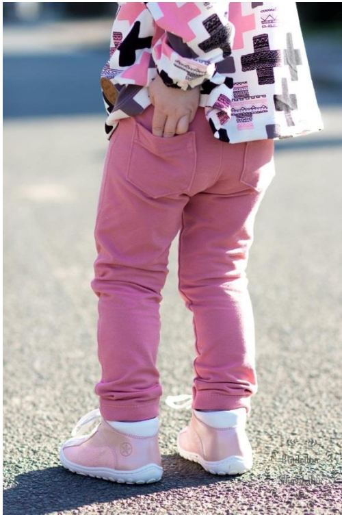
Jeggings mit Seitennähten und Gesäßtaschen

Mit bestem Dank an meine Probenäherinnen!