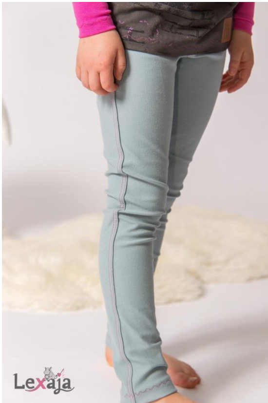
Jeggings mit abgesteppter Seitennaht