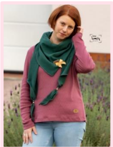
großes Tuch spitz