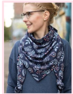
großes Tuch geknotet