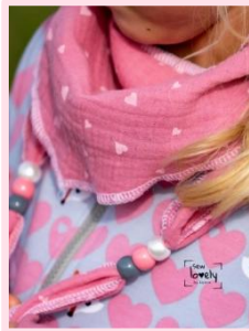
Verzierung mit Perlen