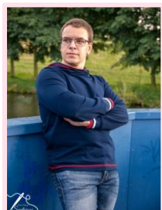
Cover-Kontrast- Nähte und unten gesäumt