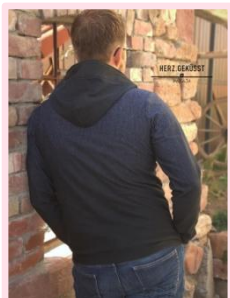
mit runder Kapuze