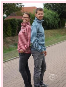
Partnerlook mit dem „Ladies Basic Hoodie“ möglich