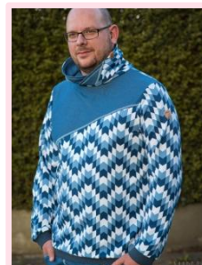
mit schräger Teilung