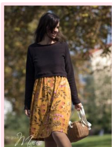
Cropped Länge als Sweater