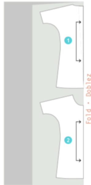
Fabric #1 • Tela #1