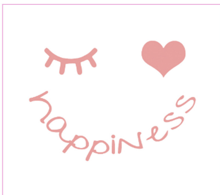
Beispiel eintarbige Datei

Bei Dateien die dies erfordern liegt eine einfache Version bei (zum Beispiel um sie einfarbig zu plotten). Außerdem enthalten komplexere/mehrfarbige Dateien bereits eine Datei mit einem Raster zum plotten. Hier sind die einzelnen Elemente in den jeweiligen Einzelfarben schon so angelegt, dass sie nach dem Skalieren auf die gewünschte Größe später ganz einfach aufgebügelt werden können - ohne groß herum arrangieren zu müssen. Ausserdem ist die Reihenfolge nummeriert, dies soll das Aufbügeln erleichtern.