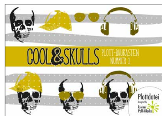
Plotterdateien „cool Skulls“ Cooles und Totenköpfe