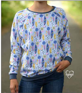
klassischer Pulli aus einem Stoff

Der Long ,n' Crop Pulli ist ein Fledermauspullover mit Raglanärmeln. Er sitzt weder oversize noch eng. Die lange Version reicht bis zu den Gesäßtaschen, die Crop Version ist bauchfrei. Der normale Halsausschnitt ist ein enger Rundhals und die weite Ausschnittvarian kann locker getragen werden und mit etwas Zug auch einseitig oder beidseitig schulterfrei. Ob dein Kind die kurze oder schulterfreie Variante ohne ein Top drunter trägt, kannst du selbst entscheiden. Das PolliX-Top ist aber ein sehr beliebtes und gut geeigneter Kombinationsschnitt.