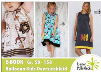
Balloona Kids Oversizekleid Oversizekleid • Größe 50 - 158