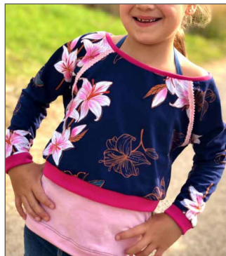
weiter Hals, kurze Variante über dem PolliX auch für kleine