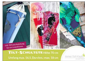
Freebook Tilt-Schultüte Schultütenschnitt Gr. 70 cm