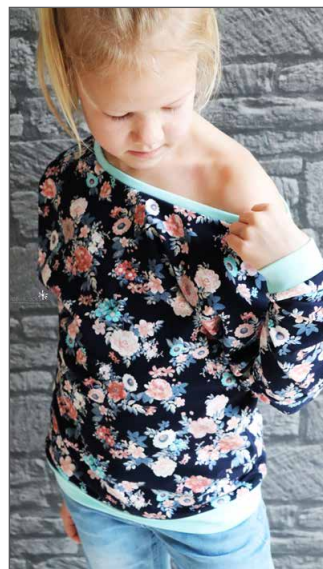
normal lang weiter Hals