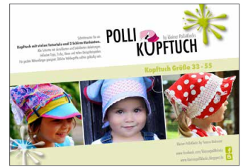
Polli-Kopftuch Kopftuch • Größe 33-55