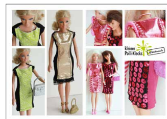
Puppenkleidung für die „schmalen Damen“