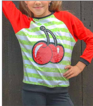
klassischer Pulli mit anders farbigen Ärmeln