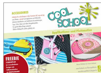
Plotterdateien „Cool School“ Rund um die coole Schule