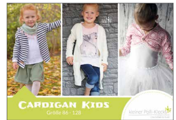
Cardigan Kids Jacke/Mantel • Größe 86 - 128