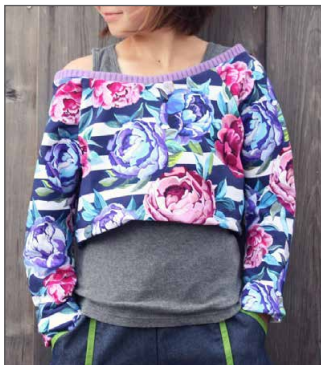
weiter Hals, kurze Variante über einem Tanktop