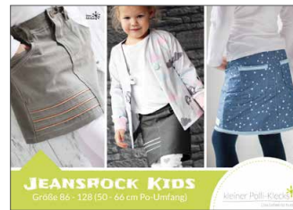
Jeansrock Kids Jeansrock • Größe 86 - 128