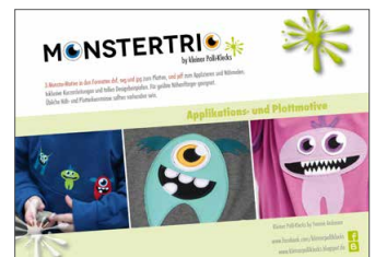
Plotterdateien „Monstertrio“ 3 Monsterfreunde