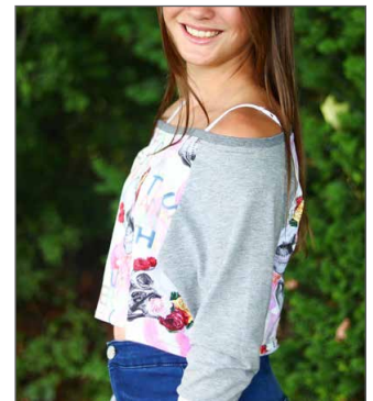
weiter Hals, kurze Variante sehr beliebt bei den Teens