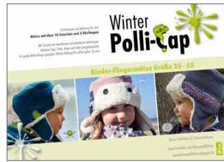
kleine Winter Polli-Cap Fliegermütze • Größe 33-55