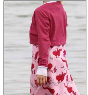
enger Hals, kurze Variante perfekt als „Bolero“-Ersatz