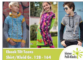
Tilt Teens Shirt/Kleid • Größe 128 - 164