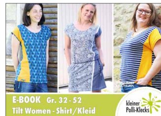
Tilt Damen Shirt/Kleid • Größe 34 - 52