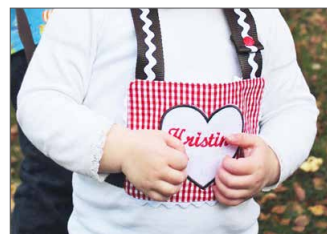
Pferdeleine zum Pferdchen Spielen