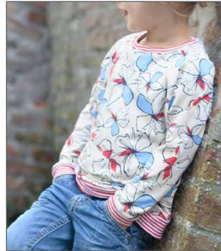
klassischer Pulli perfekt für kleine Mäuse