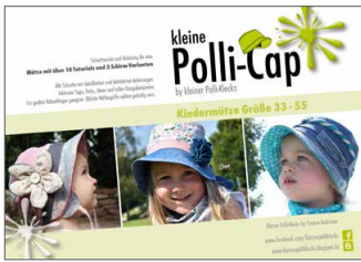
kleine Polli-Cap Sonnenhut • Größe 33-55