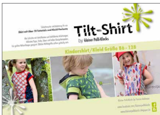
Tilt Kids Shirt/Kleid • Größe 86 - 128