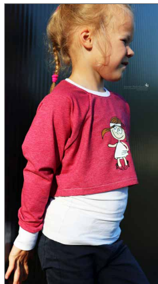
bauchfrei normaler Hals