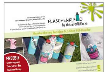
Flaschenkleid für 0,5 PET-Flaschen