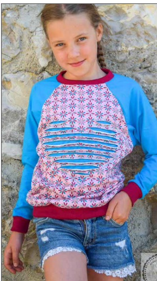
normal lang normaler Hals