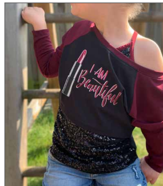
weiter Hals, kurze Variante eine freie Schulter