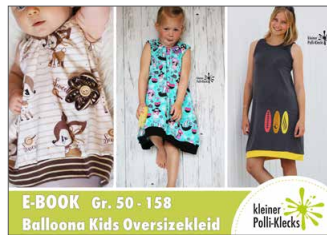
Balloona Oversizekleid Ballonkleid • Größe 50 - 158