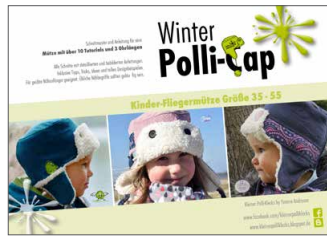
kleine Winter Polli-Cap Fliegermütze • Größe 33-55