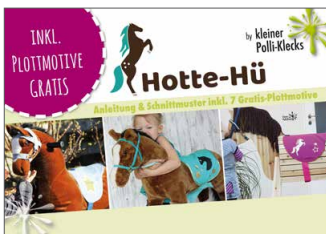
Hotte-Hü Pferddecke Für alle Spielperde