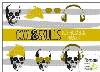
Plotterdateien „cool Skulls“ Cooles und Totenköpfe