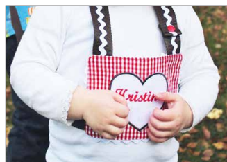
Pferdeleine zum Pferdchen Spielen