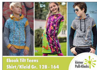
Tilt Teens Shirt/Kleid • Größe 128 - 164