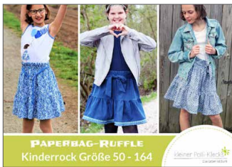
Paperbag-Ruffle Rock Kinderrock • Größe 50 - 164