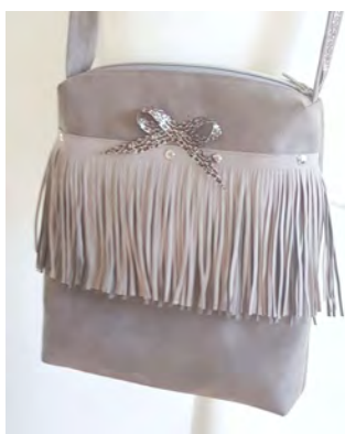
Eingefasster Schulterriemen Vorbereitung Hier im Ebook erklärt