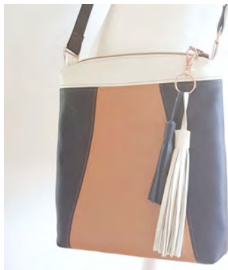
Benni mit Teilung A Vorbereitung der Außentasche: Hier im Ebook auf Seite 8-11