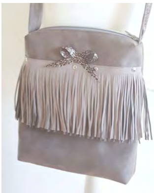
Schlichte Benni ohne Teilungen Vorbereitung der Außentasche: Hier im Ebook auf Seite 7.

Da Benni sehr umfangreich ist und du die Träger, sowie Außenteile auf verschiedene Weisen nähen kannst, geben wir dir auf den nächsten Seiten Fotobeispiele aller Varianten, die in den Tutorials erklärt werden. Daneben findest du immer einen kleinen Notizblock, auf den du dir notieren kannst, welche Seiten des Ebooks für dich besonders relevant sind. Die Tutorials hängen dem Ebook an oder sind öffentlich auf dem Blog von Mrs. Little Things https://www.mrs-little-things.de einsehbar.