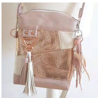
Benni Dekoaufhängung außen Die Dekoaufhängung kann nur in Kombination mit Teilung A oder B genäht werden. Hier im Ebook auf Seite 13-15