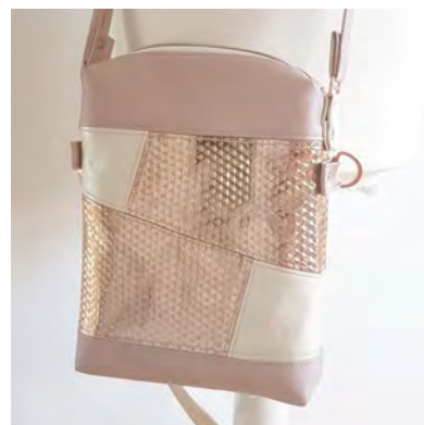
Benni mit Teilung B Vorbereitung der Außentasche: Hier im Ebook auf Seite 12-17