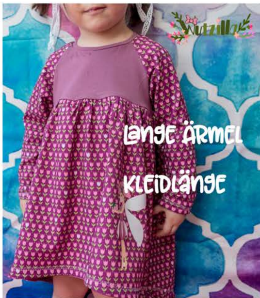
Wutzilla LANGE ÄRMEL KLEIDLÄNGE