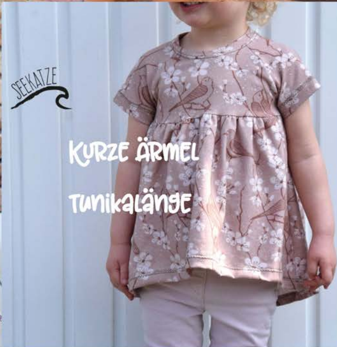
SEEKATZE KURZE ÄRMEL TUNIKALÄNGE

Maeum ist ein vielseitiger Raglanschnitt, der schön locker fällt und immer wieder neu kombiniert werden kann. Mit langen oder kurzen Ärmeln, als Tunika oder Kleid oder die super angesagten Flügelärmel machen deine Maeum garantiert zu einem Unikat.