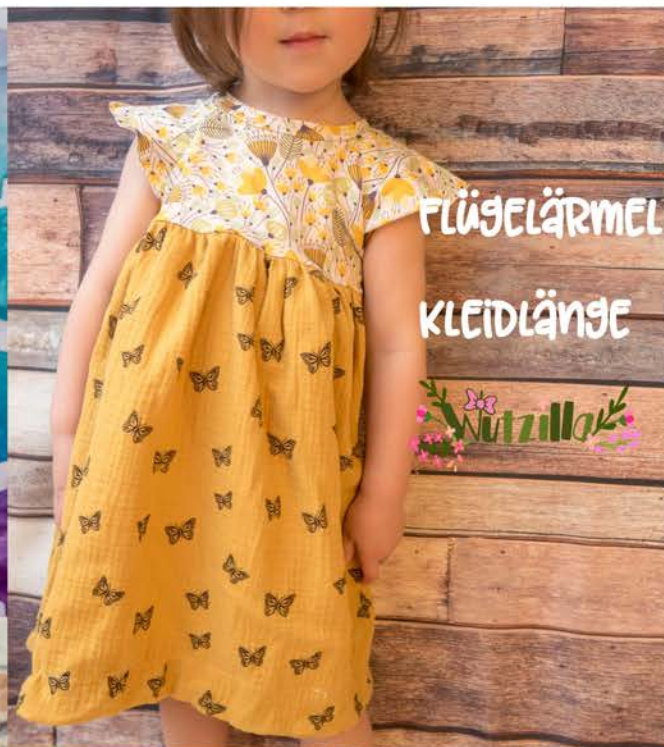
FLÜGELÄRMEL KLEIDLÄNGE Wutzilla