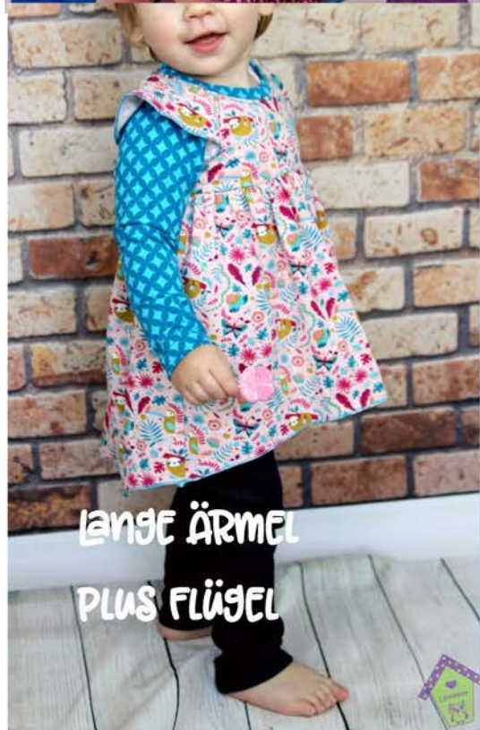
LANGE ÄRMEL PLUS FLÜGEL SEEKATZE