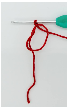
Voici un cercle magique

Répéter les indications entre parenthèses autant de fois que noté sur le rang. Le travail se fait en spirale : donc on place un marqueur de rang pour se repérer.