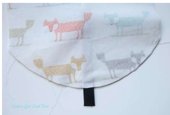
Etape 3-2 : Coudre sur 2 cm depuis A et entre les repères B et A