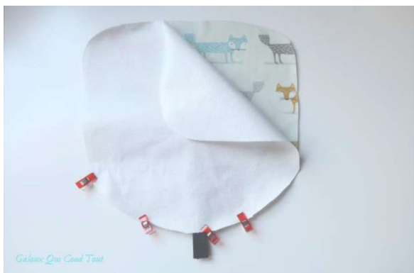
Etape 3-1 : Assemblage de l'assise