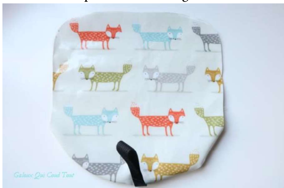
Etape 3-3 : Retournez sur l'endroit