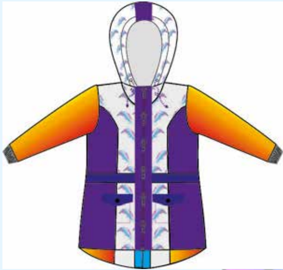
Jacke mit länglicher Teilung, geteilter Kapuze und gebogenem Abschluss hinten