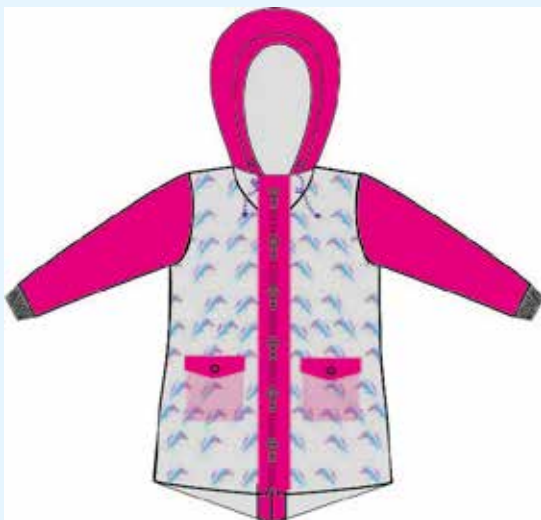
Jacke ohne Teilungen, einfache Kapuze, spitz zulaufender Abschluss hinten