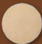
Dessous de verre Ø 10 cm