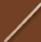
Tige de bois