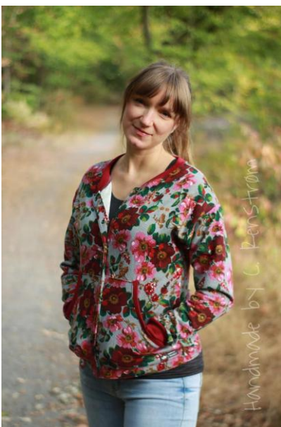
kurz, Sommersweat, mit Druckknöpfen, hoher Ausschnitt