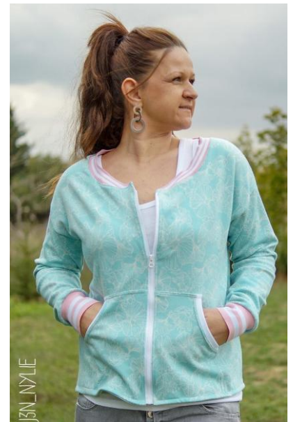
kurz, Sommersweat, mit Reißverschluss, tiefer Ausschnitt