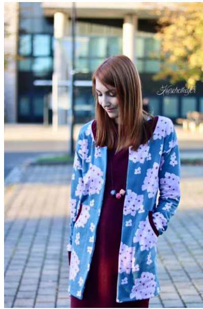
Lang, Sommersweat ohne Verschluss, tiefer Ausschnitt