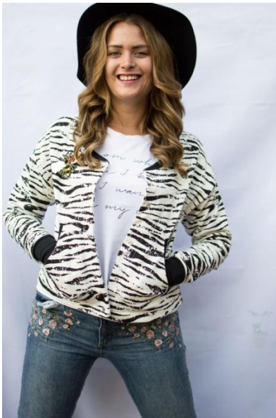
kurz, French Terry, ohne Verschluss, tiefer Ausschnitt

Unter dem jeweiligen Bild findest du Infos zur genähter Variante und gegebenenfalls Informationen, falls du etwas beachten musst.