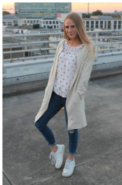
lang, dünner Strickstoff, ohne Verschlüsse, hoher Ausschnitt