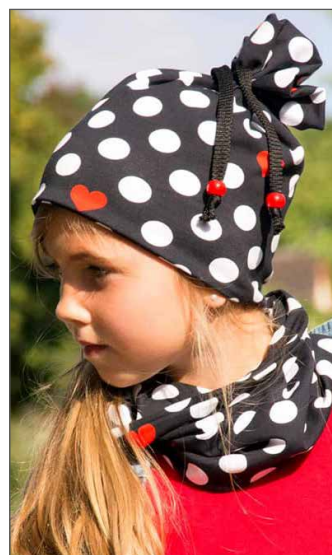
Schal Seite 6 - 8