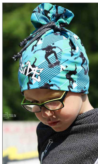
Bommelmütze Seite 6 - 8