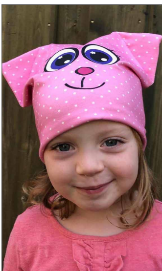
Katzenmütze Seite 5