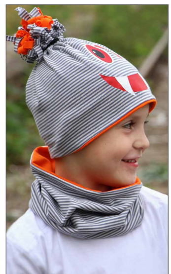
tolle Ideen Seite 9