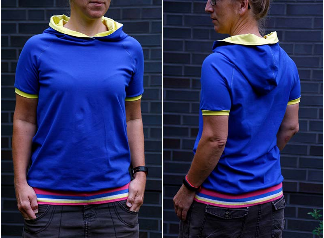
Genäht von doros kinderreich