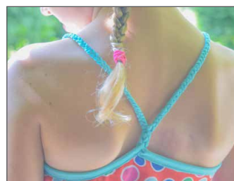
geflochtene Träger Seite 23 - 24