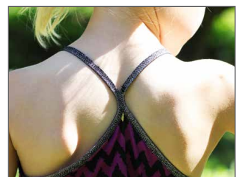
Falz-/Kantengummi Seite 25 - 29