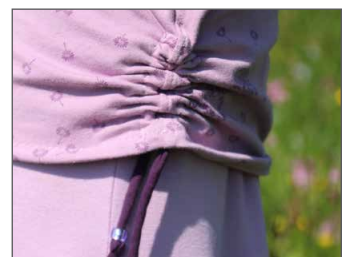
seitliche Raffung Seite 36