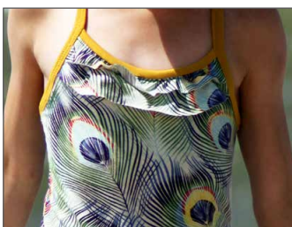
Rüschen Seite 30