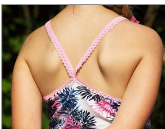
Rüschengummi Seite 8 - 16