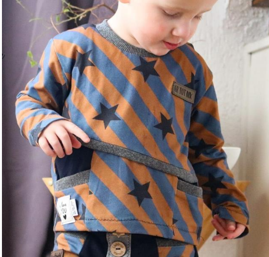
Sweatshirt mit Teilungen und Taschen