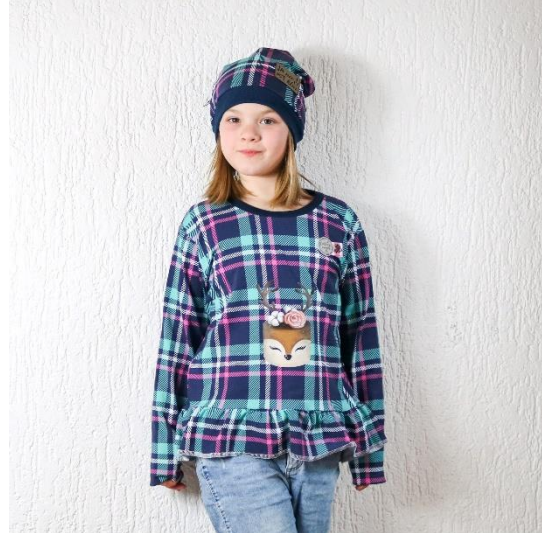
Sweatshirt mit Volant als Shirt