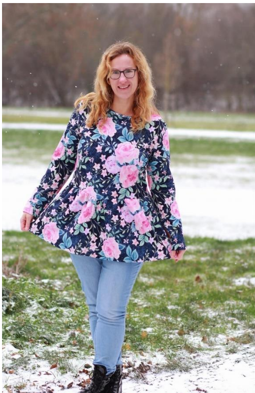
Flouncy Hoodie aus French Terry ohne Brustabnäher, mit Halsbündchen und normalen, gesäumten Ärmeln

Alle Rechte dieses Ebooks (Anleitung und Schnittmuster) liegen bei „Schneiderline“ Für Fehler in der Anleitung oder im Schnittmuster oder für eventuell entstandene Schäden kann keine Haftung übernommen werden. Es ist verboten dieses Ebook, oder Teile daraus, zu veröffentlichen, weiterzugeben, zu vervielfältigen oder zu verkaufen. Ebenfalls ist eine gewerbliche sowie kommerzielle Nutzung untersagt. Es dürfen jedoch bis zu 5, nach diesem Ebook gefertigte Teile verkauft werden. Hierbei bitte angeben: Schnittmuster „Flouncy Hoodie Damen“ von Schneiderline