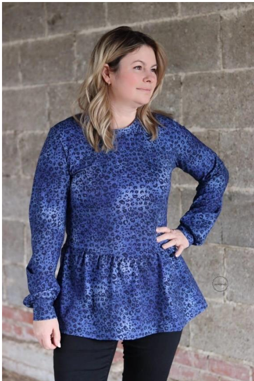
Flouncy Hoodie aus Jersey mit Halsbündchen und Bischofsärmeln