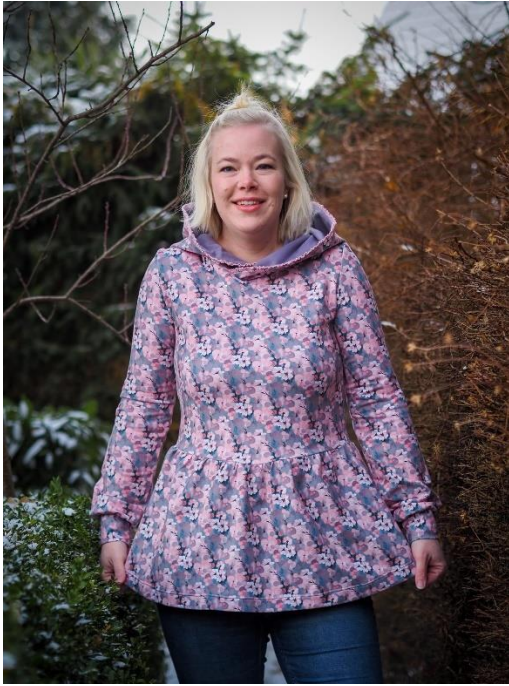
Flouncy Hoodie mit Kapuze aus French Terry, Vorderteil mit Brustabnähern und Bischofsärmel

Alle Rechte dieses Ebooks (Anleitung und Schnittmuster) liegen bei „Schneiderline“ Für Fehler in der Anleitung oder im Schnittmuster oder für eventuell entstandene Schäden kann keine Haftung übernommen werden. Es ist verboten dieses Ebook, oder Teile daraus, zu veröffentlichen, weiterzugeben, zu vervielfältigen oder zu verkaufen. Ebenfalls ist eine gewerbliche sowie kommerzielle Nutzung untersagt. Es dürfen jedoch bis zu 5, nach diesem Ebook gefertigte Teile verkauft werden. Hierbei bitte angeben: Schnittmuster „Flouncy Hoodie Damen“ von Schneiderline